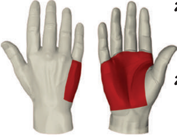
Takviye alanını belirtir.